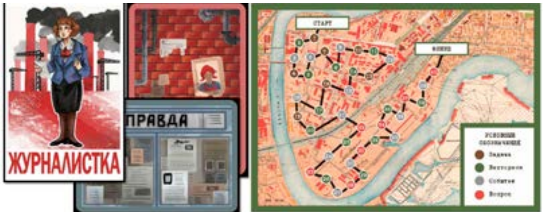
Рис. 2. Дизайн-макеты игрового поля и игровых карточек