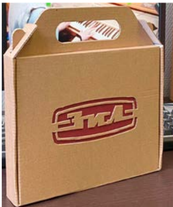
Рис. 3. Фото картонной упаковки настольной игры