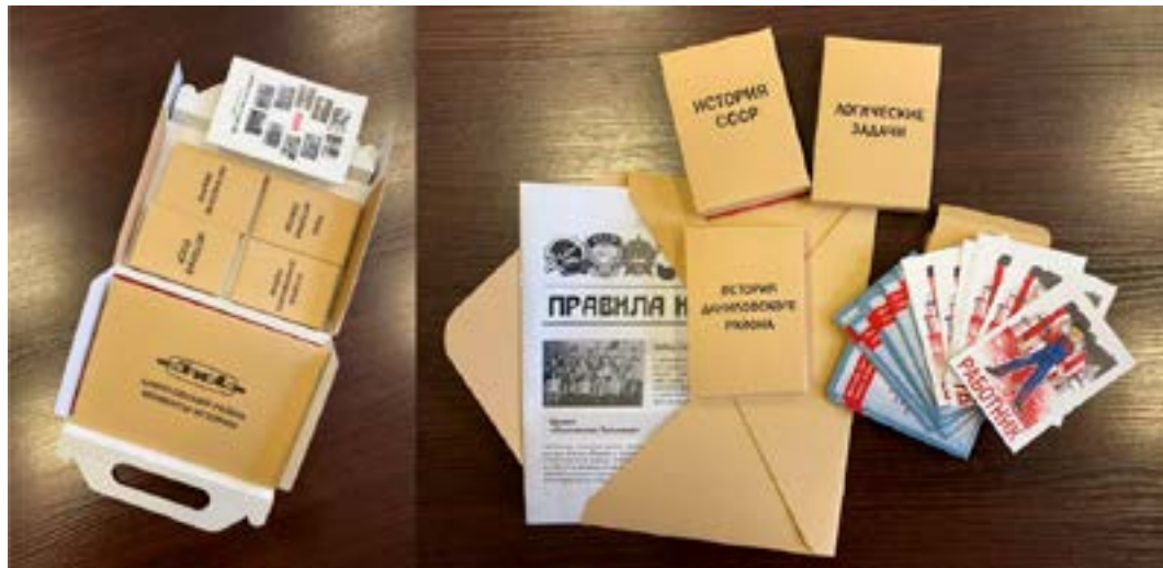
Рис. 4. Фото элементов настольной игры

компонентов: настольная игра на основе исторических событий, связанных с Зааводом имени И. А. Лихачева; справочные материалы (набор открыток о ДК ЗИЛ, буклет о Павловской больнице). Все компоненты взаимосвязаны правилами игры и представляют собой единый образовательный контент, посвященный истории Даниловского района Москвы в годы войны.