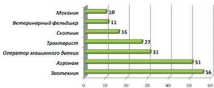
Рисунок 2. Наиболее востребованные вакансии агропромышленного профиля (по данным Департамента по труду и занятости населения Свердловской области, сайм: www.szn-ural.ru )

Для качественного анализа процессов развития занятости в АПК и составления прогнозных показателей полезно провести систематизированную оценку рынка труда региона. Оценку существующей ситуации и выявление тенденций на рынке труда АПК (по профессиям и специальностям) мы вынуждены делать с опорой на анализ вторичных документов Департамента по труду и занятости населения Свердловской области и Министерства агропромышленного комплекса и продовольствия Свердловской области, так как другие источники информации отсутствуют. Этот процесс требует государственного регулирования, в том числе разработки прогноза потребностей рынка труда, который позволил бы в целом урегулировать отношения между сферой образования и рынком труда.