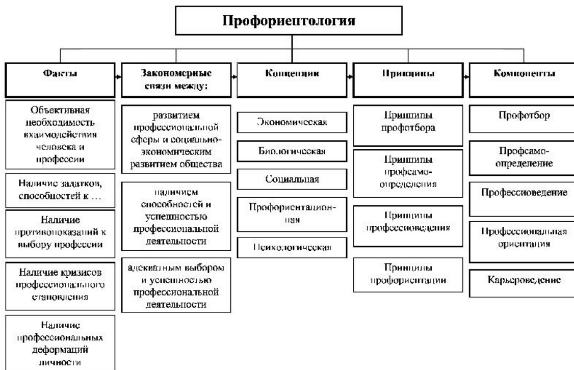
Рис. 1. Теоретико-методологическая модель научной дисциплины «Профориентология».