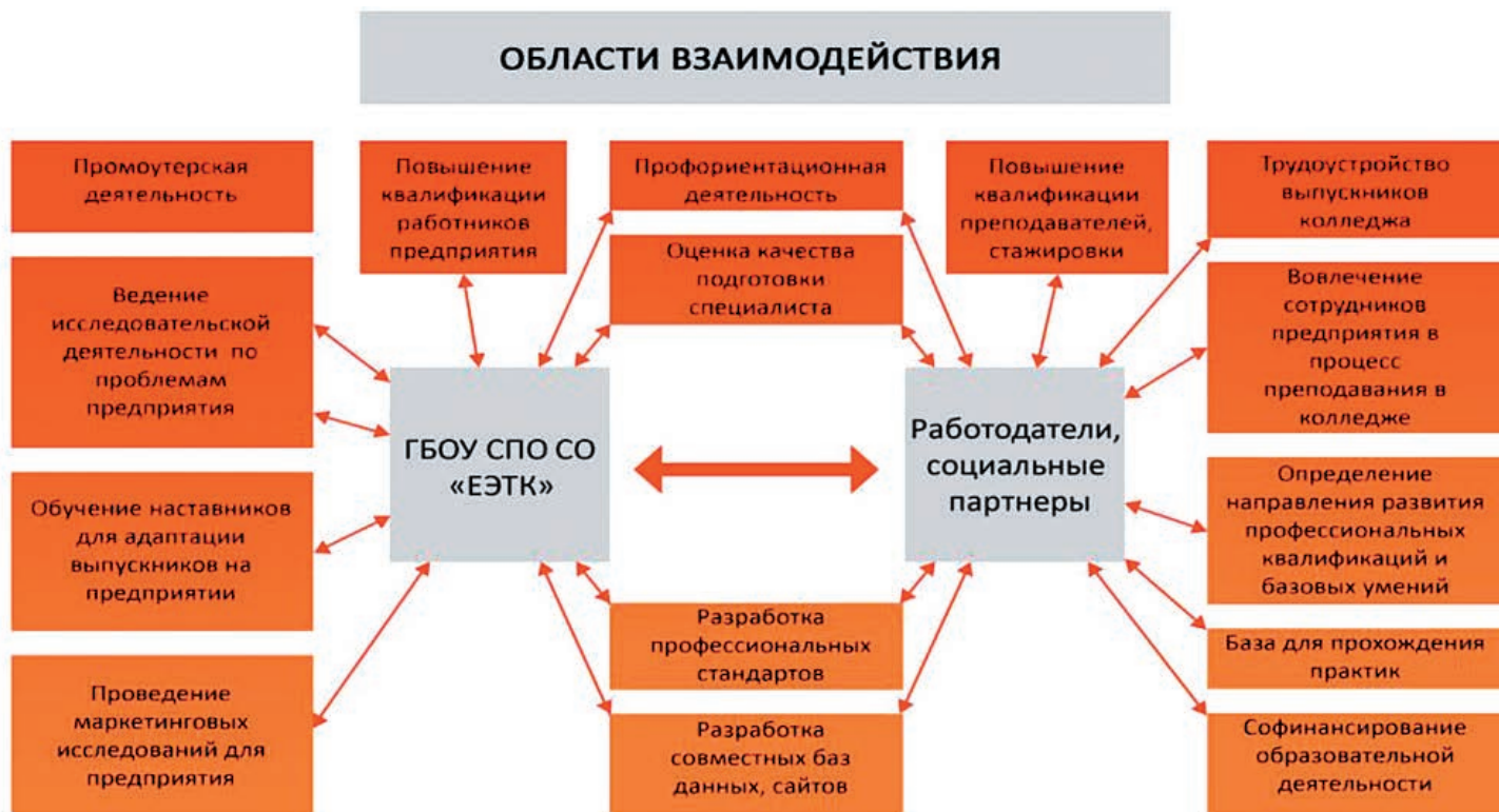
Рис.2 Области взаимодействия колледжа, социальных партнеров и работодателей

Модель формирует инновационную образовательную среду колледжа, обеспечивающую объективное взаимодействие с обучающимся, способную защищать его на определенных этапах познания и направленную на формирование и развитие профессионально-личностной модели выпускника, конкурентоспособного на рынке труда, владеющего знаниями, умениями, практическим опытом, профессиональными и общими компетенциями, определенными ФГОС СПО и профессиональными стандартами. Модель представляет собой педагогическую систему, которая является совокупностью взаимосвязанных средств, методов и процессов, необходимых для создания организованного, целенаправленного, преднамеренного педагогического влияния на формирование личности. Данная модель является открытой и развивающейся системой и предполагает непрерывное совершенствование, уточнение, дополнение новым содержанием в соответствии с развитием системы профессионального образования, экономики региона, требованиями рынка труда в подготовке конкурентоспособных специалистов.