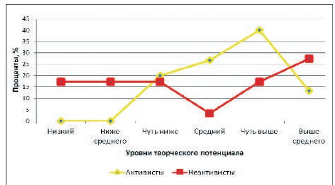
Рис. 2. Динамика творческого потенциала у «активистов» и «неактивистов» (V курс)