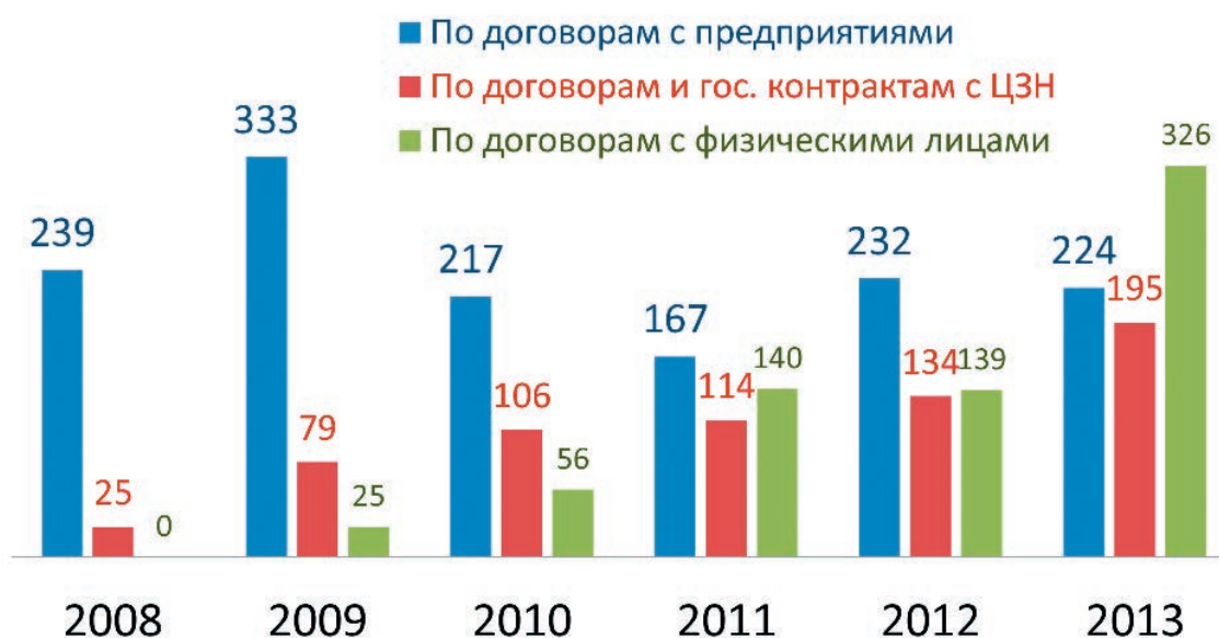
Количество обученных граждан в период 2008–2013 гг.

В целях максимальной реализации своих лицензионных возможностей и удовлетворения растущих потребностей заказчиков в образо-