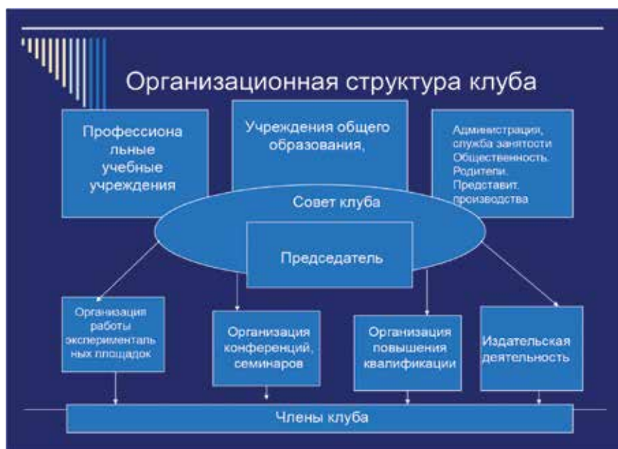
Рис. 2. Организационная структура клуба

– формирование и развитие профессиональной культуры, планирование профессиональной карьеры, продолжение образования (для студентов);