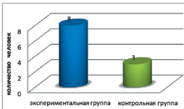
Рис. 2. Результаты успеваемости студентов